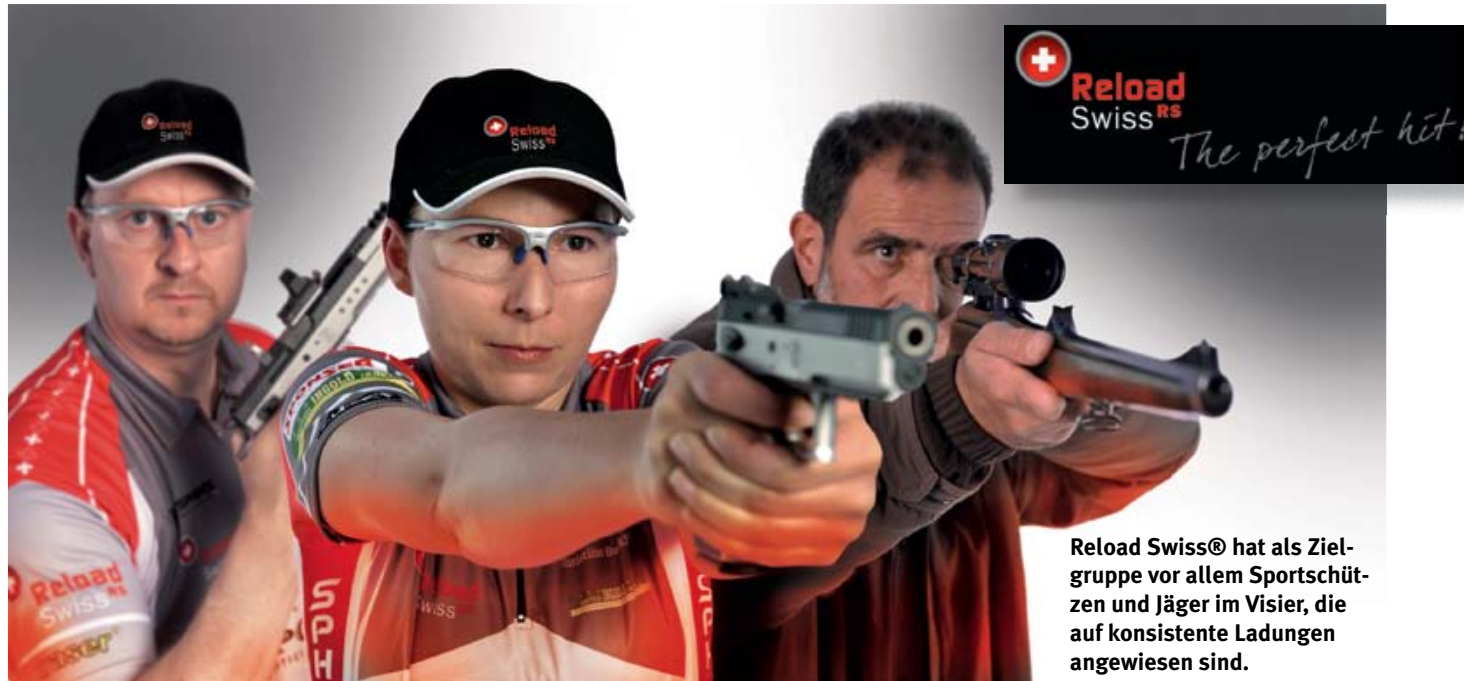
Reload Swiss® hat als Zielgruppe vor allem Sportschützen und Jäger im Visier, die auf konsistente Ladungen angewiesen sind.

Nach der sommerlichen Präsentation für den Fachhandel und die Presse sind nun die neuen RS-Pulver ausgeliefert worden. Die zehn Sorten decken ein weites Kaliberspektrum ab, die Schweizer Qualität verspricht Gleichmässigkeit auf hohem Niveau.